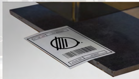
APPLICAZIONE A BANDIERA