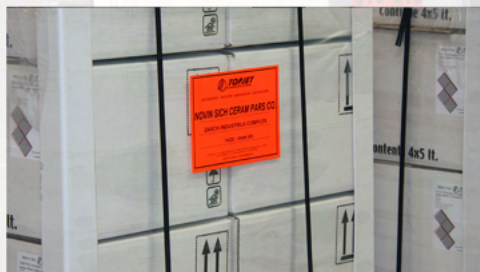
APPLICAZIONE SU PALLET FORMATO A5