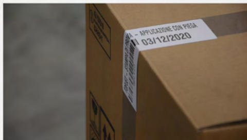
APPLICAZIONE CON PIEGA A 90°

Le Eticode 600-700-1000 sono progettate e realizzate interamente da Topjet. Tutti i componenti sono testati e controllati in fase di assemblaggio. L'efficacia dei nostri sistemi "stampa e applica" è testimoniata dalle numerose applicazioni industriali costruite nel corso dei 30 anni.